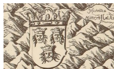
Fig. 10 Depiction of the Dalmatian coat-of-arms and Jesenica Fort (Stjepan Glavač: Nova hactenus editarum mendis expurgatis , 1673, detail). Slika 10. Prikaz dalmatinskog grba s tvrđavom Jesenica (Stjepan Glavač: Nova hactenus editarum mendis expurgatis , 1673, isječak).