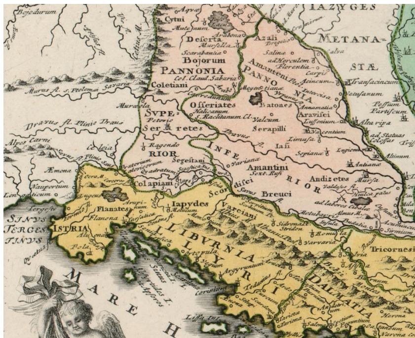
Fig. 13 Representation of Upper and Lower Pannonia in red (Christoph Weigl: Regiones Danubianae, Pannoniae, Dacia, Moesiae cum Vicino Illyrico , 1720, detail).