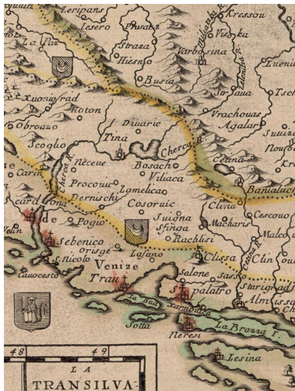
Slika 3. Dvostruko razgraničenje Dalmacije (Pierre Duval: Les confins des chrestiens et des Turcs en terre ferme , 1663, isječak).