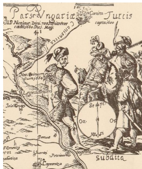
Slika 6. Prikaz dijela Ugarske pod osmanskom vlašću (Stjepan Glavač: Nova hactenus editarum mendis expurgatis , 1673, isječak).

Ono što je također zanimljivo na toj karti je i prikaz onih zemalja koje nisu spomenute u naslovu karte, a riječ je o Srbiji ( Servie ) i Albaniji ( Albanie ). Osim njihova topografskog prikaza uočava se i sljedeće: kod prikaza Srbije nema prikaza grba kojim je određena njezina politička i kulturalna pripadnost, što predstavlja popriličnu dilemu s obzirom na činjenicu da je Srbija u navedenom periodu bila pod osmanskom vlašću (slika 4), dok se u slučaju Albanije uočava prikaz grba s polumjesecom, što sugerira činjenicu da se ona nalazi u islamskom, odnosno osmanskom kulturnom krugu (slika 5). Također, zanimljivo je da na toj karti nema ni grbovnog prikaza Dubrovačke Republike; međutim, ova je tvrdnja potkrijepljena činjenicom da je Dubrovačka Republika bila manje važan politički faktor od Habsburške Monarhije i Osmanskog Carstva (Brković i Mlinarić 2013, 43). Razlog za takvu distinkciju nalazi se, kao i u prethodnom slučaju s dvostrukim razgraničenjem Dalmacije (autorova osobna percepcija), međutim također se može raditi i o