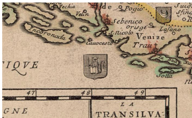
Slika 2. Prikaz dalmatinskog grba blizu dalmatinske obale (Pierre Duval: Les confins des chrestiens et des Turcs en terre ferme , 1663, isječak).