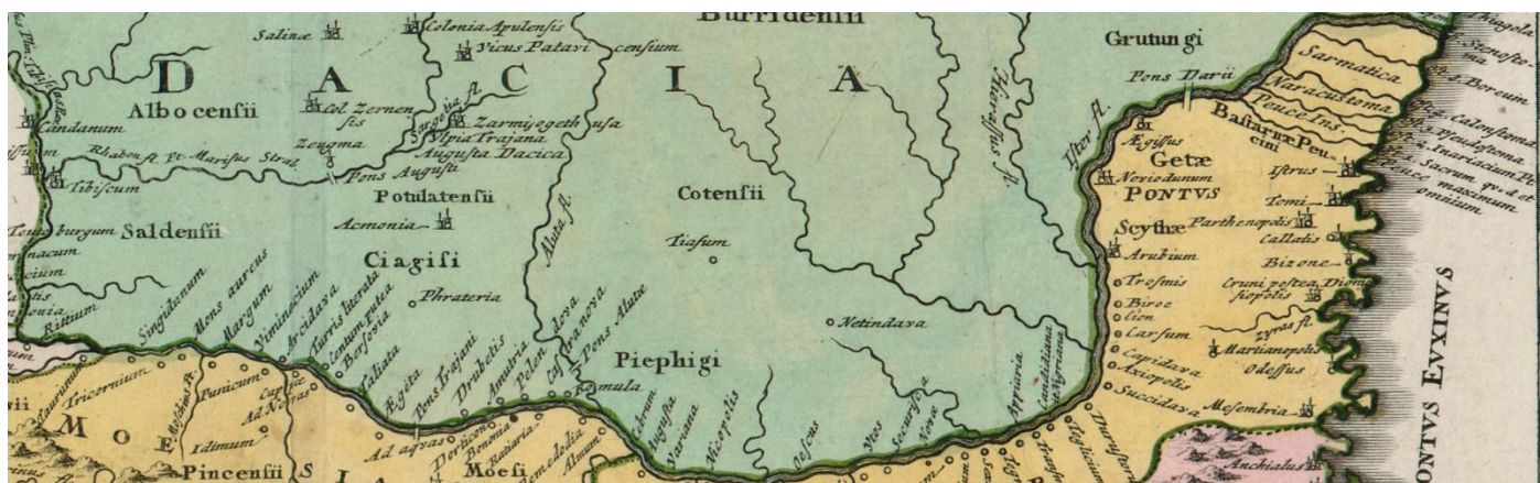
Slika 15. Donji krak Dunava nazvan antičkim imenom Ister (Christoph Weigl: Regiones Danubianae, Pannoniae, Dacia, Moesiae cum Vicino Illyrico , 1720, isječak).