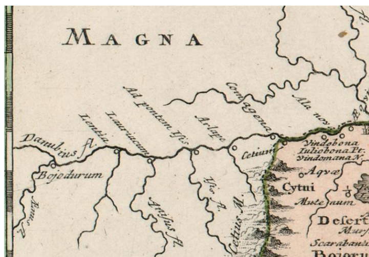
Slika 14. Rijeka Dunav u toku kroz Austriju s današnjim imenom (Christoph Weigl: Regiones Danubianae, Pannoniae, Dacia, Moesiae cum Vicino Illyrico , 1720, isječak).

Weiglova karta, nastala 1720. godine, po svojem geografskom opsegu obuhvaća još veći prostor od Duvalove – naime u njezin su sastav uključeni Podunavlje, Panonija, Moezija, Dacija, Tracija te Makedonija i Tesalija. 7 Hrvatske su zemlje dosta nezgrapno prikazane te se stječe dojam da su one stiješnjene u odnosu na prethodno spomenute zemlje. Toponomastika je koncentrirana na područje južne Dalmacije, dok su sjeverni dijelovi rijetko obilježeni. Također je zanimljivo da nema prikaza planina na području Gorskog kotara, Istre, Primorja, Like i Dalmatinske zagore, dok je područje Bosne prikazano tek djelomično točno. Nema čak ni topografskog prikaza Zagreba, dok se rijeka Sava prikazuje kao Plinijeva Sava ( Savus A. Plinio ). Iznad Siska ona je prikazana kao Quadramtum Segestica ins. et urbs . Međutim, kod Vinkovaca se može vidjeti prikaz bitke u