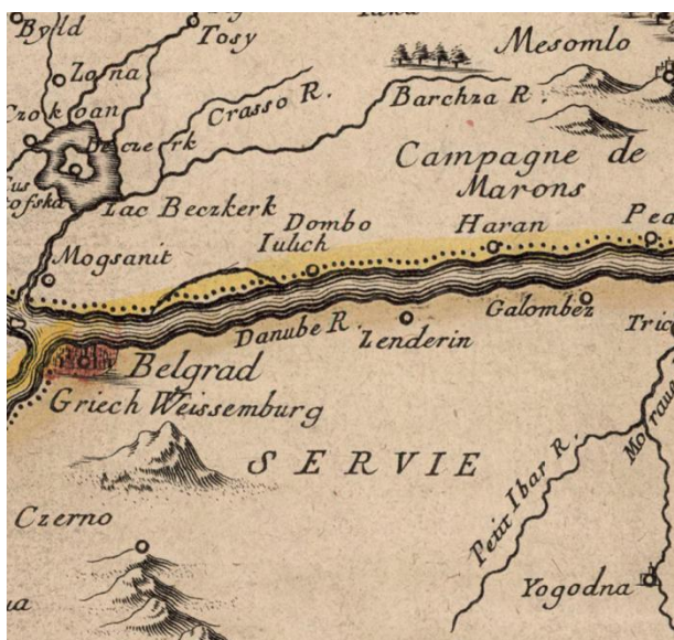
Fig. 4 Representation of Serbia without a related coat-of-arms (Pierre Duval: Les confins des chrestiens et des Turcs en terre ferme , 1663, detail).