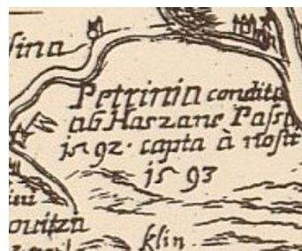
Slika 12. Prikaz Petrinje s podacima o bitci iz 1592. godine (Stjepan Glavač: Nova hactenus editarum mendis expurgatis , 1673, isječak).

Razlog se nalazi na samoj karti. Glavač je u posveti istaknuo kako je bio razočaran zbog površne izradbe svih dotadašnjih karata koje su prikazivale hrvatske zemlje, dok su karte susjednih zemalja bile daleko preglednije (Marković 1993, 186). Također je važno napomenuti kako je Glavač pri izradi svoje karte bio povezan s vojnim zapovjednicima u ogulinskoj tvrđavi koji su ga upozorili na nedostatke pri prethodnim kartiranjima hrvatskih i susjednih zemalja, ali je taj argument preslab da bi dokazao razlog zašto se Glavač odlučio na prikaz baš tog dijela Ugarske. S druge strane, moguće je da se ovdje radi, kao i kod Duvalove karte Hrvatske, o procesu odrugotvorenja po principu mi-oni (Mlinarić i Gregurović 2011, 354), što pojašnjava i spomenuti prikaz Ugarske i naziv karte. Međutim, ovdje se otvara novo pitanje: zašto se Glavač pri izradi karte odlučio prikazati samo dijelove hrvatskih zemalja izvan osmanske vlasti, za razliku od Duvala koji je prikazao i njihov