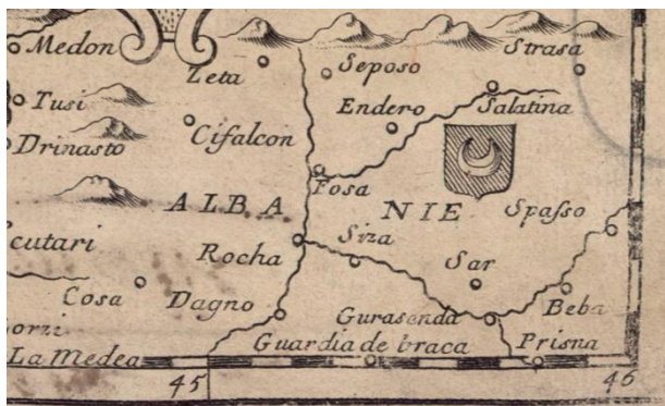
Slika 5. Prikaz Albanije s pripadajućim grbom (Pierre Duval Les confins des chrestiens et des Turcs en terre ferme , 1663, isječak).

Fig. 5 Representation of Albania with a related coat-of-arms (Pierre Duval: Les confins des chrestiens et des Turcs en terre ferme , 1663, detail).