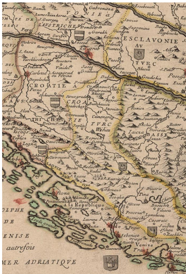
Fig. 1 Detail of Duval's map which clearly shows the division of the Croatian lands (Pierre Duval: Les confins des chrestiens et des Turcs en terre ferme , 1663).