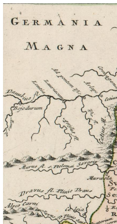
Slika 17. Habsburška monarhija prikazana kao dio Velike Njemačke (Christoph Weigl: Regiones Danubianae, Pannoniae, Dacia, Moesiae cum Vicino Illyrico , 1720, isječak).

Unatoč njihovim razlikama, sva su tri izvora dokaz da je u kartografiji prisutna propaganda. Međutim, ne treba sve interpretacije protumačiti isključivo kao propagandu. Potrebna je detaljna analiza uzimajući u obzir okolnosti u kojima su karte nastale i autorovo poznavanje kartiranog područja. Kartografski izvori nisu puki komadi papira koji predstavljaju određene teritorije,