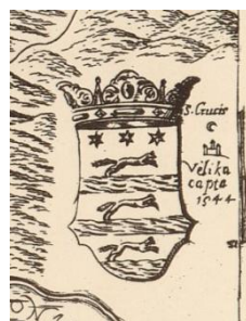
Fig. 9 Depiction of the Slavonian coat-of-arms and the conquest of Velika (Stjepan Glavač: Nova hactenus editarum mendis expurgatis , 1673, detail). Slika 9. Prikaz grba Slavonije i podatak o osvajanju Velike (Stjepan Glavač: Nova hactenus editarum mendis expurgatis , 1673, isječak).