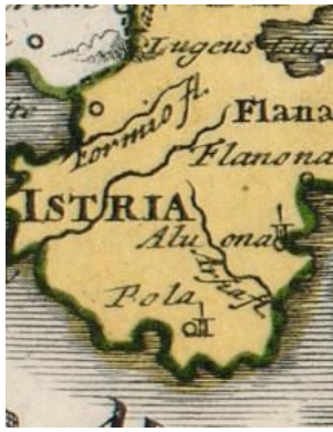
Fig. 16 Representation of Istria without reference to the Danube (Ister) (Christoph Weigl: Regiones Danubianae, Pannoniae, Dacia, Moesiae cum Vicino Illyrico , 1720, detail).