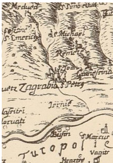
Slika 11. Položaj Zagreba (Stjepan Glavač: Nova hactenus editarum mendis expurgatis , 1673, isječak).