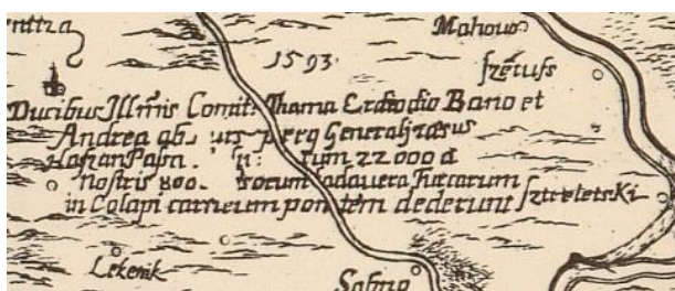
Fig. 8 Part of the map showing the description of the battle near Sisak in 1593 (Stjepan Glavač: Nova hactenus editarum mendis expurgatis , 1673). Slika 8. Dio karte koji prikazuje opis bitke kod Siska 1593. (Stjepan Glavač: Nova hactenus editarum mendis expurgatis , 1673, isječak).

development of Dalmatia, which in ancient times extended from the River Raša to Lješ in present-day Albania, with its eastern border near the river's source (Matijašić 2009, 185). This accounts for the positioning of its coat-of-arms.