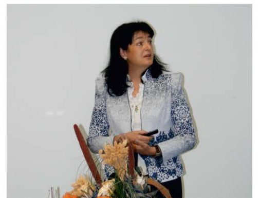
13th International Conference on Geoheritage, Geoinformation and Cartography Selce, 7–9 September 2017