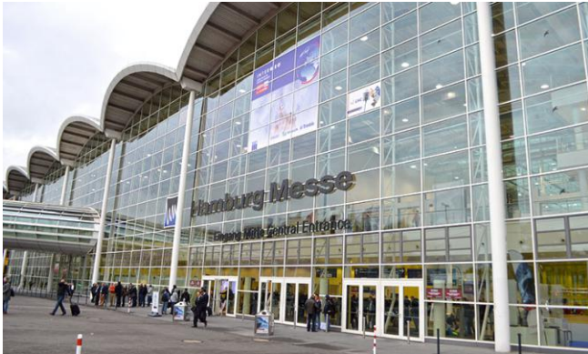
The entrance to the Intergeo fair 2016 in Hamburg Ulaz u Intergeo 2016. u Hamburgu