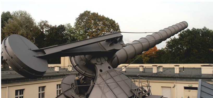
The longest mobile telescope located in the Archenhold observatory Najdulji pokretni teleskop na Zemlji, smješten u opservatoriju Archenhold

Archenhold Observatory in Berlin about the museum of the observatory and the longest moveable refractive telescope on Earth. The telescope is 21 meters long and can be used to observe stars, but only when the sky is clear, with no clouds to obscure vision. Other attractions in the Archenhold Observatory include the historic Einstein's room, a small Zeiss planetarium and giant metallic meteorites.