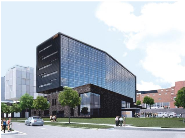
The headquarters of the COWI company in Copenhagen Sjedište tvrtke COWI u Kopenhagenu