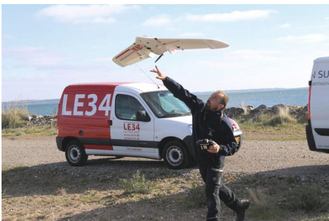
Presentation of geodetic survey field work in LE34 company Prikaz terenskog rada geodeta u tvrtki LE34

The second educational journey, attended by students of the Faculty of Geodesy, University of Zagreb, lasted from October 10 to October 17, 2016. Forty-nine students visited three cities in Germany and one in Denmark during the journey.