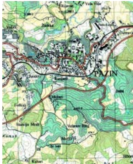
Slika 4. Isječci pokusnih karata, smanjeno približno 1,5 puta Fig. 4. Some of test maps, reduced approximately 1,5 times