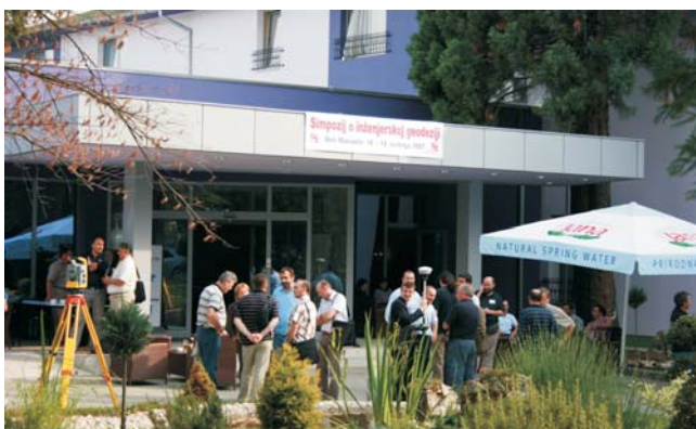
Fig. 1. Hotel Patria - location of SIG 2007

Sl. 1. Hotel Patria - mjesto održavanja SIG 2007