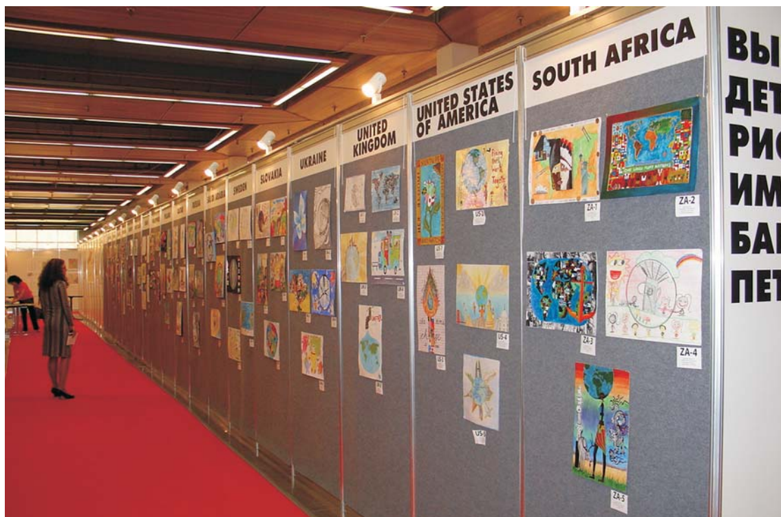
International Children's Map Exhibition, Moscow 2007

Međunarodna izložba dječjih radova, Moskva 2007.