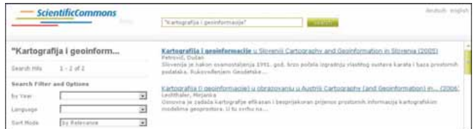
Fig. 1. Scientific Commons Sl. 1. Scientific Commons

Scientific Commons enables one to search all repositories with scientific and professional papers which support the Open Archive Initiative Protocol for Metadata Harvesting (OAI-PMH) and offer full text free of charge. Search can be done according to first and last names of au-