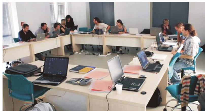
Fig. 2. The working atmosphere at GEOSTAT school

Program je vodio R. Bivand, a započeo je predavanjem Predstavljanje (podataka) u vremenu i prostoru . Naglašena je činjenica da je prikaz u vremenu drugačiji od prikaza u prostoru (tzv. prostorno-vre-