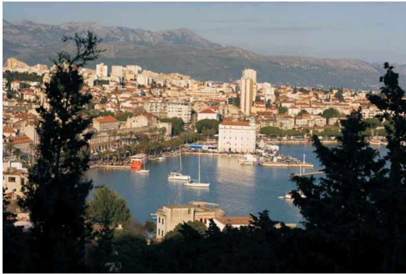
Fig. 3.

Slika 3.