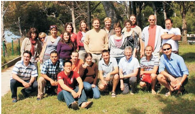
Fig. 1. Participants of the GEOSTAT 2009 Summer School, May 3-10, MEDILS, Split (Photo by Jaime Ricardo García Márquez, University of Bonn, Nees Institute for Biodiversity of Plants, Germany)

Slika 1. Sudionici ljetne škole GEOSTAT 2009, 3-10. svibnja, MEDILS, Split (snimio Jaime Ricardo García Márquez, Sveučilište u Bonu, Institut za bioraznolikost biljaka 'Nees', Njemačka)