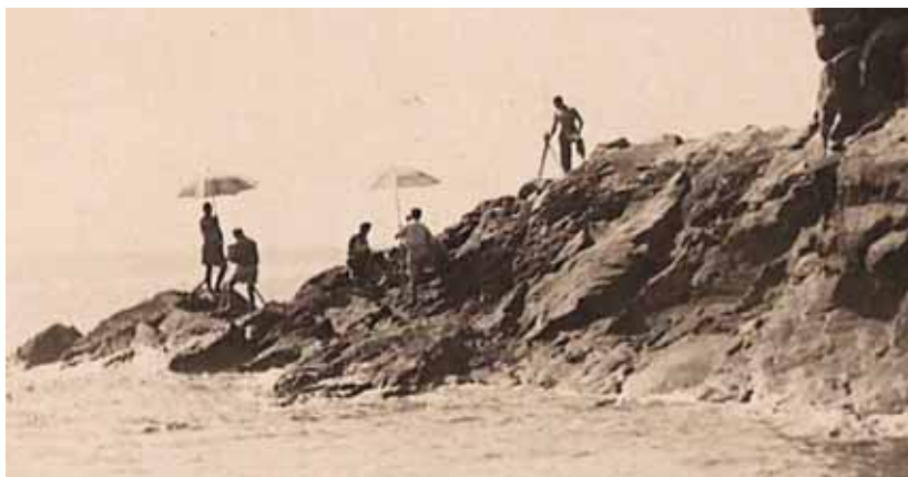
▲ Figure 2. Measurement of magnetic declination on the Jabuka Island, September 1, 1949