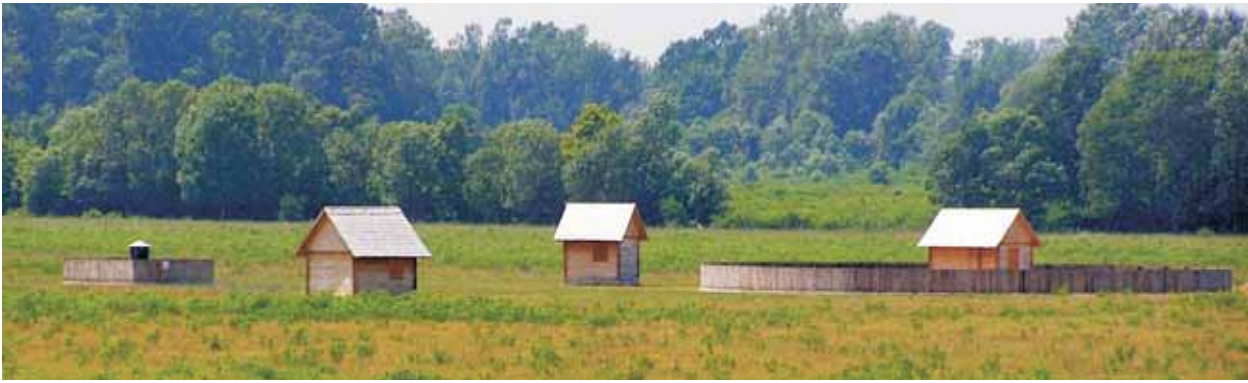
▲ Figure 5. Geomagnetic observatory in Lonjsko Polje.

▲ Slika 5. Geomagnetski opservatorij u Lonjskom Polju.