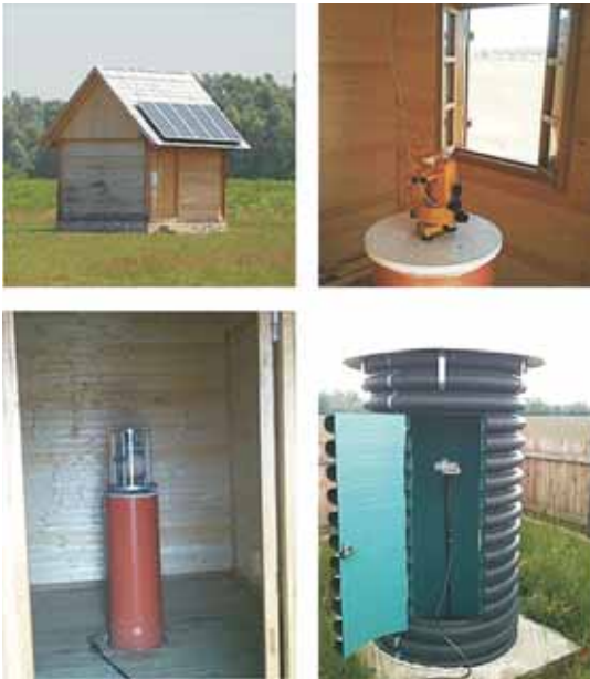
◀ Figure 6. Up left: Control house (C) with solar cells on the roof; up right: Geomagnetic theodolite; down left: dIdD magnetometer; down right: Proton magnetometer.

▲ Slika 5. Geomagnetski opservatorij u Lonjskom Polju.