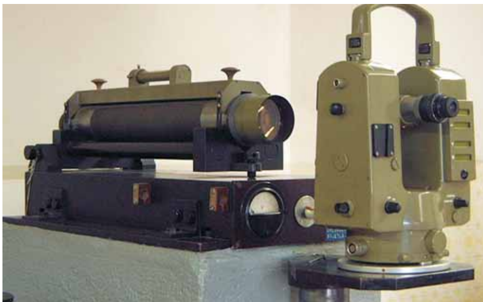
The system consisted of two collimators for examination and rectification of collimation error Sustav od dva kolimatora u pravcu, za ispitivanje i rektifikaciju kolimacijske pogreške