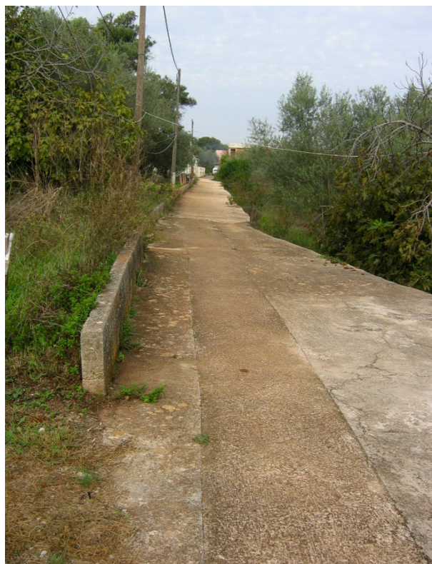
Slika 17. Dio linije centurije G. Fig. 17 Part of centuria line G.