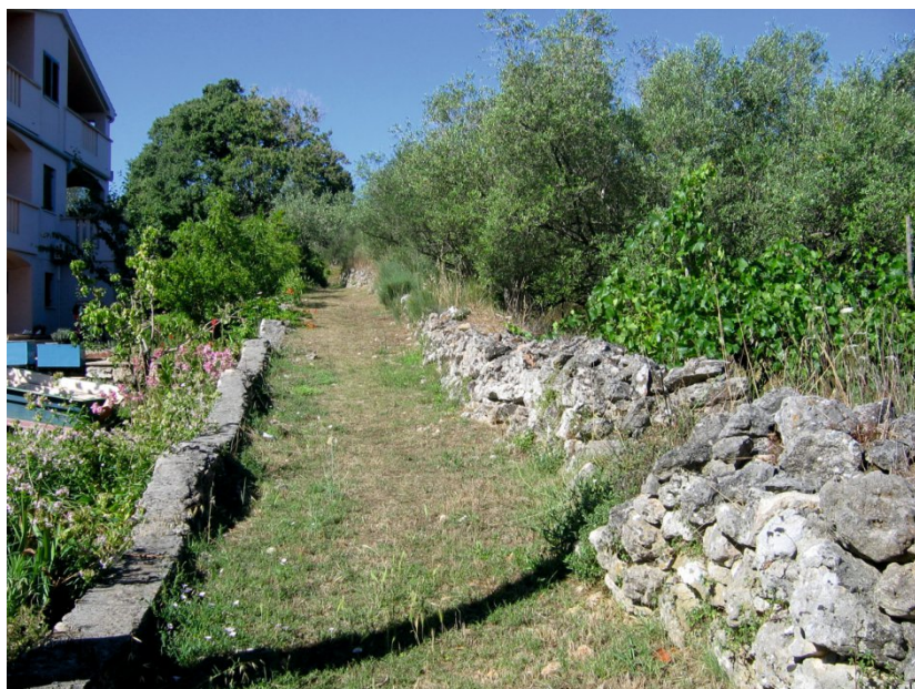
▲ Fig. 8 Heredium line C, which is a well-maintained field path today. ▲ Slika 8. Linija heredija C, danas dobro održavan poljski put.