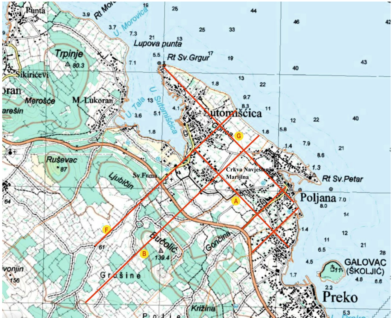
Slika 2. Položaj crkvi između Poljane i Sutomišćice na isječku topografske karte: župna crkva sv. Eufemije (sv. Fuma) spominje se sredinom 14. st., crkva sv. Grgura spominje se 1402.god., crkva Navještenja Marijina iz 1686. god. i crkva sv. Petra u Poljani. Slovima B i G označene su linije centurije, a slovima A i F linije heredija.