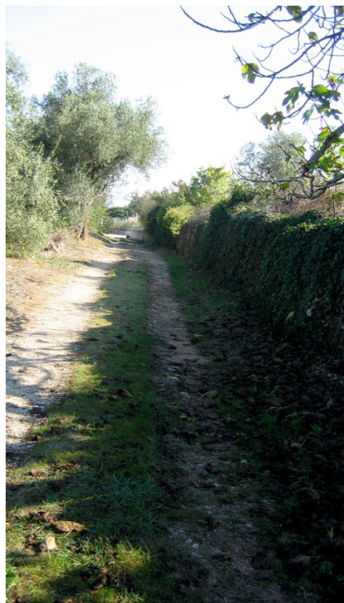
Slika 19. Put koji presijeca heredij na dva jugera. Fig. 19 Path intersecting the heredium into two jugera .