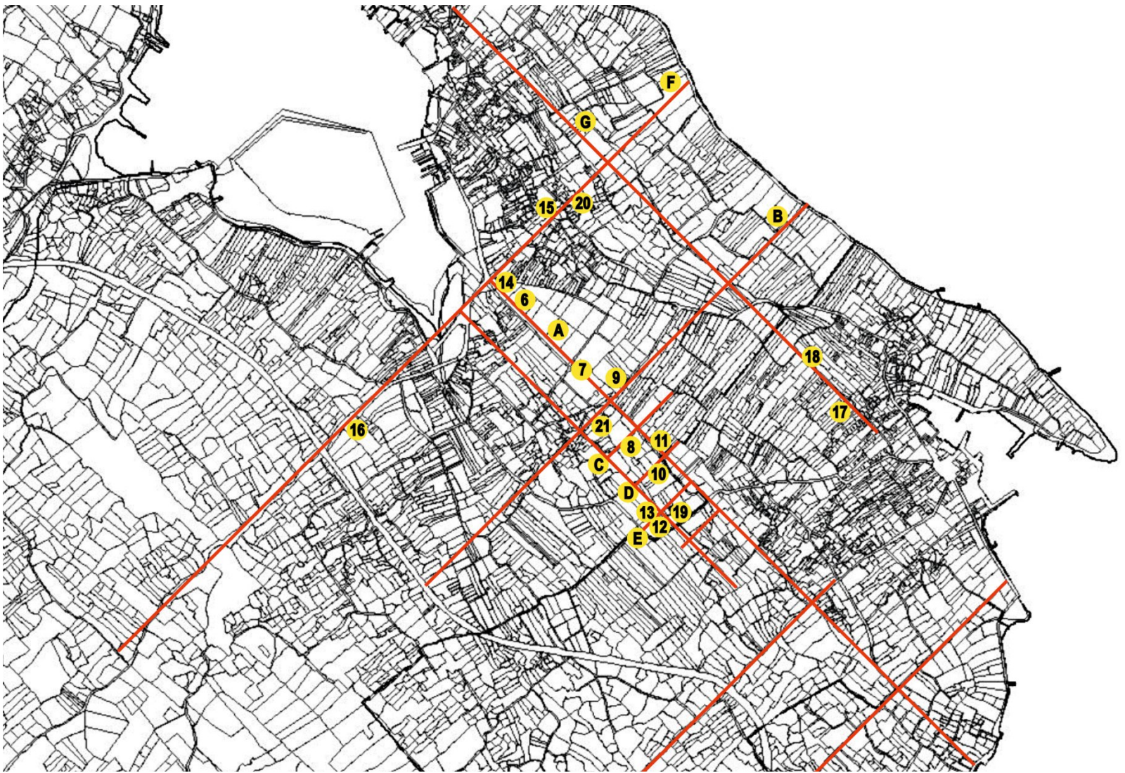
Slika 4. Današnji katastar između Poljane i Sutomišćice s istraženim prikazom podjele na centurije i heredije. Prikazane su linije centurija B i G, linije heredija A, C, D, E i F, a brojevi označuju mjesta na kojima su snimljene fotografije (slike 6–21).

Fig. 4 The modern cadastre between Poljana and Sutomišćica, with the area researched for division into centuriae and heredia . The centuria lines are marked as B and G, the heredium lines are marked as A, C, D, E, and F, and the numbers mark the places where photographs were taken (Figures 6–21).