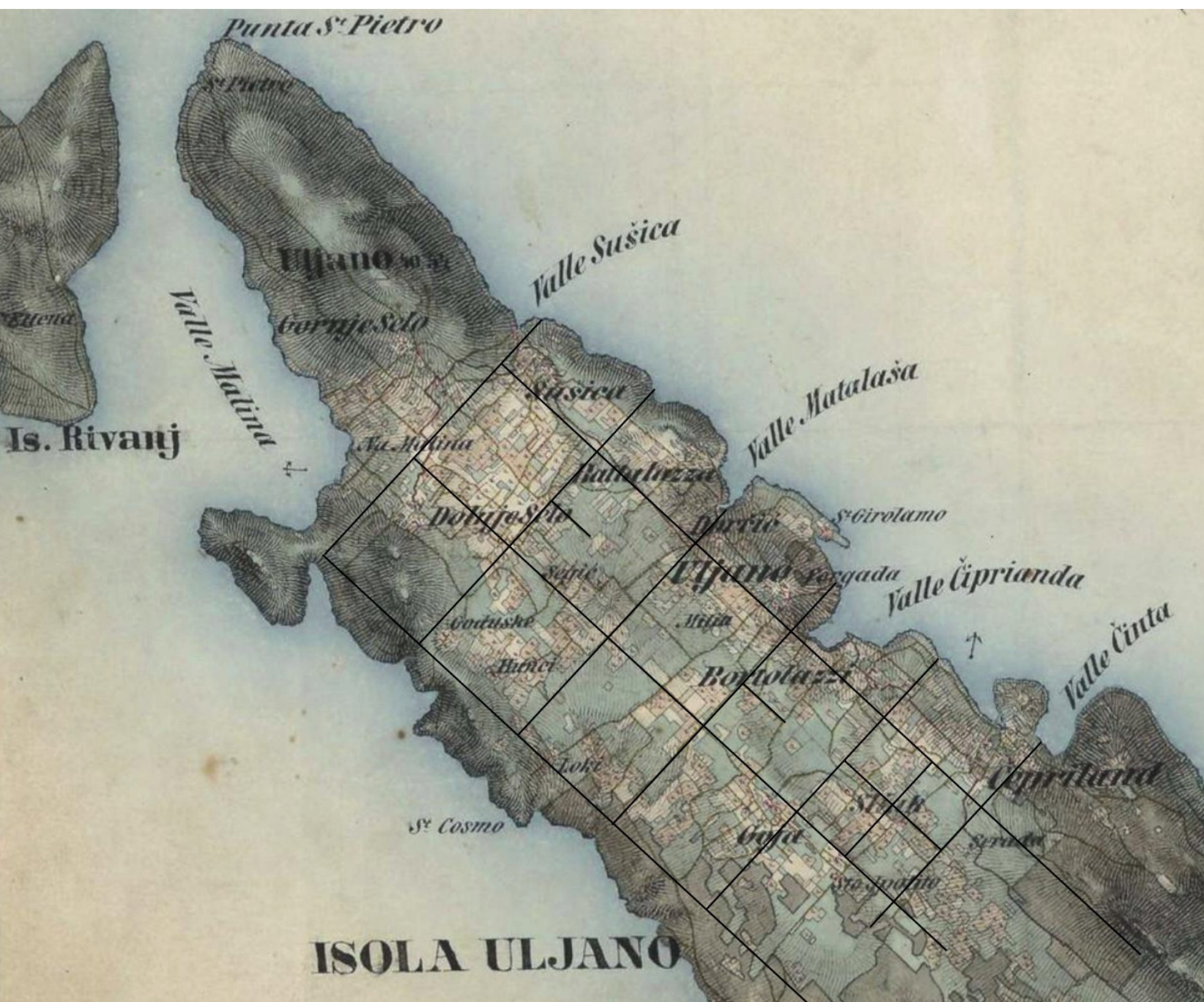
Fig. 3 Depiction of the centuriation on a historical map of the Habsburg Empire. Slika 3. Prikaz centurijacije na staroj karti izrađenoj u doba Habsburške Monarhije.

On the cadastral plans for the Sutomiščica area, dated 1619 (during the Venetian cadastre), some of the paths shown are parts of the divisions inside one centuria , and have been maintained in use to the present day ( strada Publica , Figure 1). In the Gorica area, on the Venetian cadastral plan, the ruins of a tower are drawn, but it does not ex-