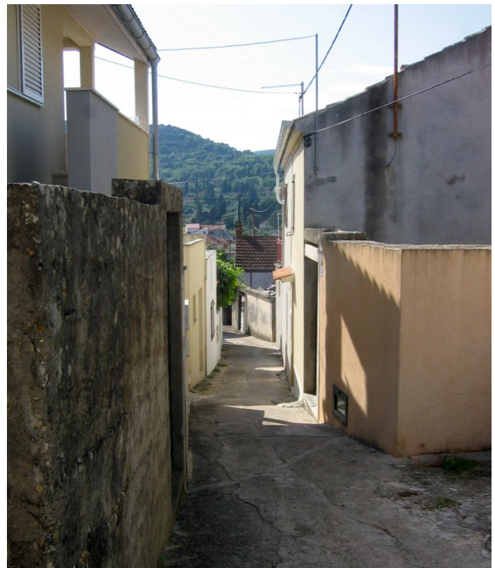
Fig. 14 (left) and Fig 15 (right) Heredium line F. Slika 14. (lijevo) i Slika 15. (desno) Linija heredija F.