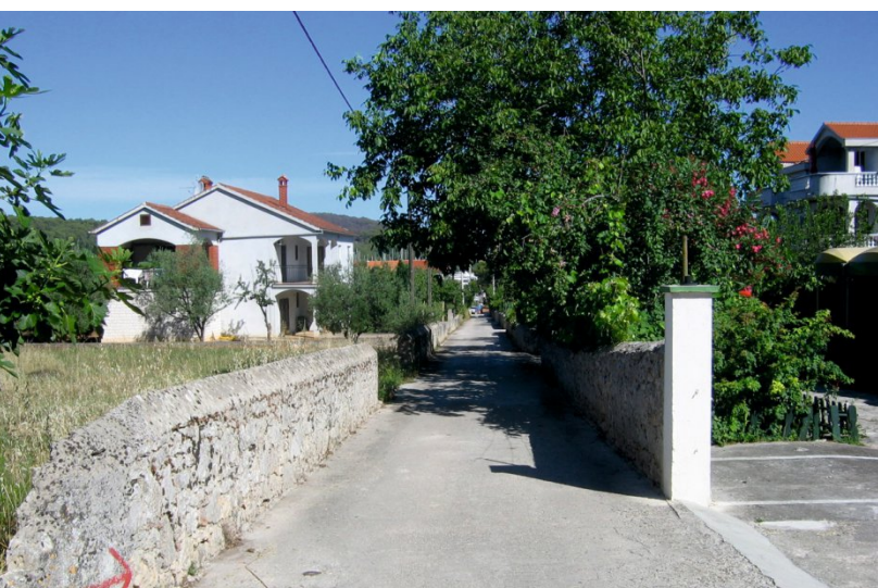
▲ Slika 6. Ulica Štradun, na liniji heredija A, vodi prema ljetnikovcu zadarske obitelji Lantana.