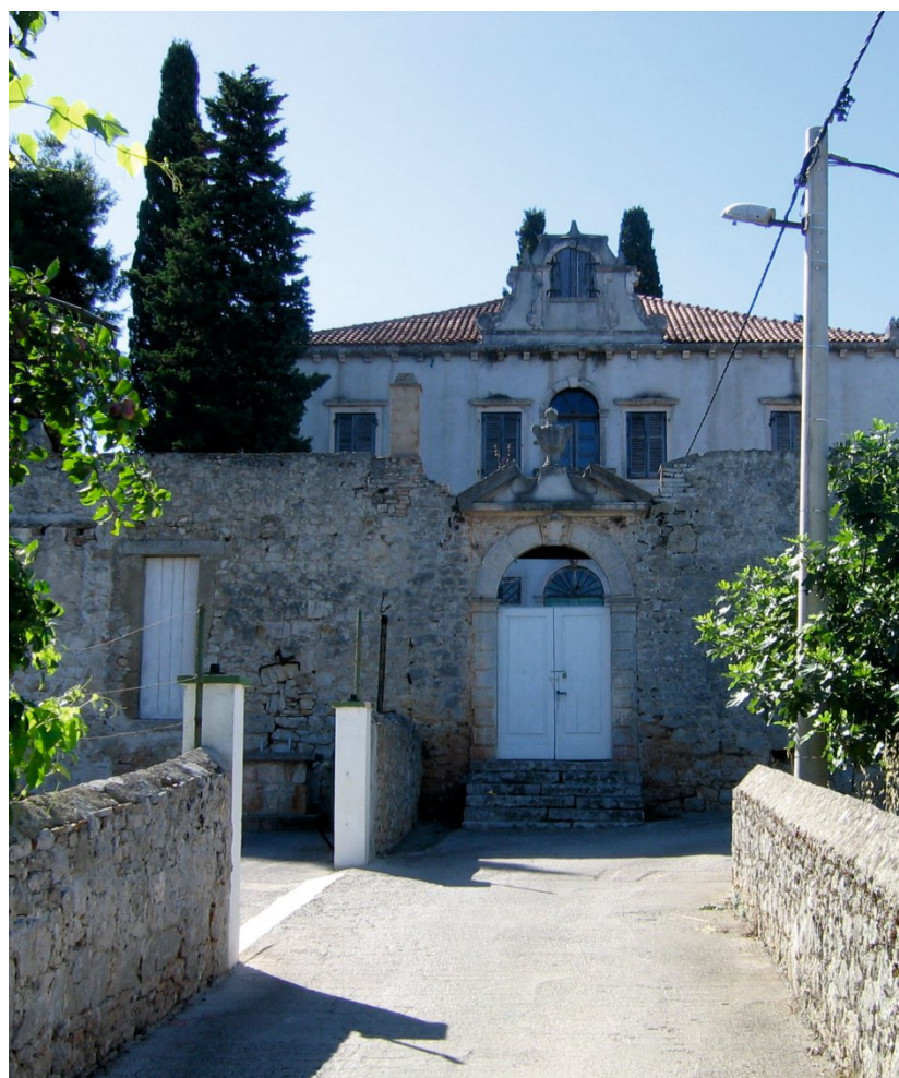
Slika 7. Ljetnikovac je sagrađen 1686. Primjer je baroknog dvorca ► venecijanskog tipa s parkom i crkvicom Navještenja Marijina. U njemu su do sredine 18 st. vršili primopredaju mletački providuri (namjesnici) (Šutrin 2000).