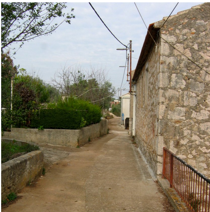
Slika 18. Dio linije centurije G. Linija centurije G završava na rtu sjeverozapadno od mjesne uvale gdje se nalazi crkva sv. Grgura (Kadi 2016).