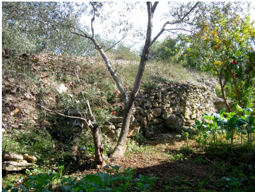
◀ Fig. 20 Stone remains of the foundations of the Venetian tower in the Gorica area.

◀ Slika 20. Kameni ostaci temelja mletačke kule na području Gorice.