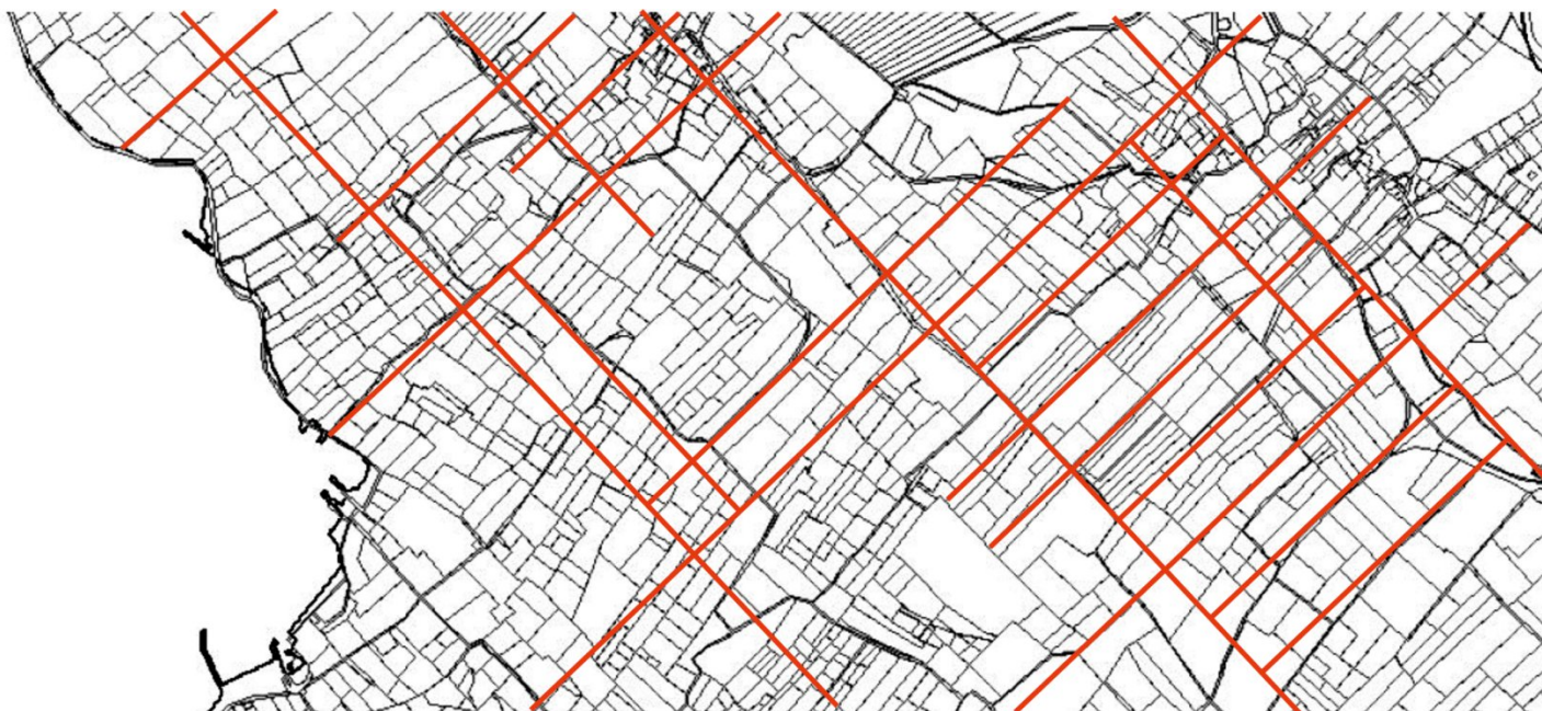
Fig. 5 The area of Muline on the background of the modern cadastre. Slika 5. Prikaz centurijacije područje Mulina na podlozi današnjeg katastra.