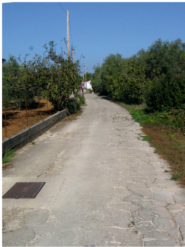
Slika 11. Nastavak linije heredija A iza dvorca Lantana. Fig. 11 Continuation of heredia line A behind the Lantana villa.