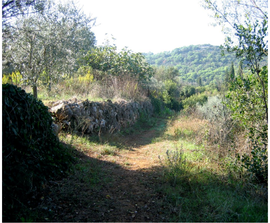
Fig. 12 (left) and Fig. 13 (right) Path and overgrown drywall on heredium line E. Slika 12. (lijevo) i Slika 13 (desno) Put sa zaraštenim suhozidom koji predstavlja liniju heredija E.