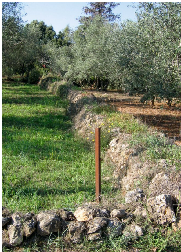
Slika 10. Suhozid na liniji heredija D. Fig. 10 Drywall on heredium line D.