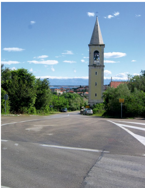
Slika 16. Linija heredija F. Fig. 16 Heredium line F.