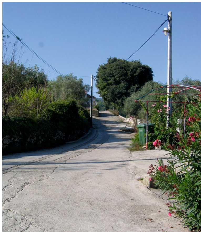
Fig. 9 Intersection of centuria line B and heredium line A. ▶ Slika 9. Križanje linija centurije B i heredija A. ▶