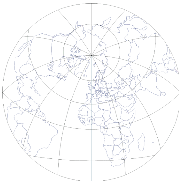
Fig. 4 Oblique aspect of conformal azimuthal projection

Slika 3 Poprečni aspekt konformne azimutne projekcije