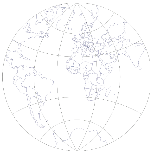
Fig. 3 Transverse aspect of conformal azimuthal projection

Slika 3 Poprečni aspekt konformne azimutne projekcije