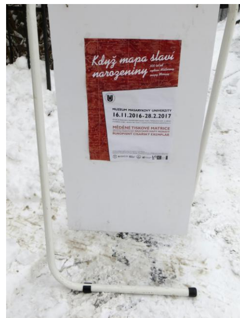
Informative poster about cartographic exhibition in Mendel's museum of the Masaryk University Informativni plakat o kartografskoj izložbi u Mendelovu muzeju Masarykova sveučilišta