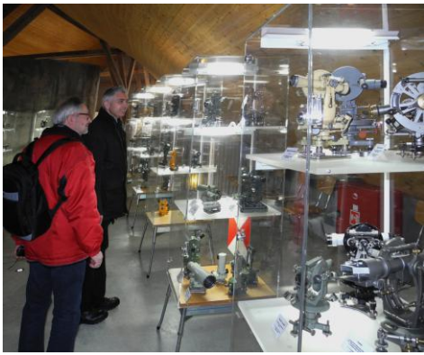
Rich collection of optical geodetic instruments Bogata zbirka optičkih geodetskih instrumenata