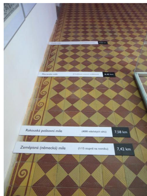
Various units of distance Mjerne jedinice za duljinu