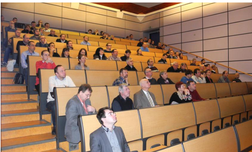
GNSS seminar 2017 in the great lecture hall of the Faculty of Civil Engineering, Brno University of Technology

Održavanje GNSS seminara 2017 u velikoj predavaonici Građevinskog fakulteta Tehničkog sveučilišta u Brnu