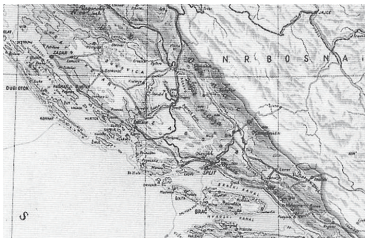
Figure 8. Excerpt from Narodna Republika Hrvatska by A. Milohnoja, original scale 1:1,000,000 (Pandžić, 1992; NSB, X-H-A-9)

Drugi mletački kartografski izvor koji sadrži istraživani toponim je karta naziva „ Tabula Comitatus Zarenensis et Sibenicensis ad Illustrationem “ autora Josepha Marianusa, koja se pojavljuje kao prilog br. 8 (Tab. VIII) u čuvenome putopisnom djelu Alberta Fortisa „ Viaggio in Dalmazia “ (Put po Dalmaciji) izvorno izdanom u Veneciji godine 1774. (slika 5). Karta prikazuje teritorijalne jedinice, tzv. „okružja“ ( contadi ) Zadra i Šibenika koje su u to vrijeme obuhvaćale područje od južnog Velebita na zapadu do Drniša i Rogoznice na istoku, kao i pripadajuće sjevernodalmatinske otoke. Osim prikaza prirodno-geografskih sastavnica, u prvom redu reljefa i hidrografske mreže, te naselja, ističu se geografska imena Kotar, Bukovizza (Bukovica), Petrovopoglie (Petrovo polje) i Zagorie (Zagorje). Ova imena označavaju pojedine regije prikazanog područja uz koje se vezuje izvorno i tradicionalno nazivlje. Pozicioniranje toponima Zagorie izvedeno je na dijelu karte koji predstavlja granični prostor šibenskog okružja, što je vidljivo po isprekidanoj crti koja dijeli prostor označen geografskim imenom, a koja očigledno označava upravno-teritorijalnu među. Percepcija prostora nazvanog Zagorie ovdje se također i u sličnom obimu odnosi na prostor dijela zaobalja između Šibenika i Trogira, s rijekom Čikolom ( Cicolla ) kao sjevernom međom.