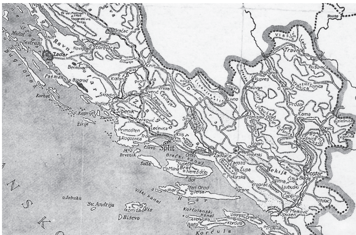
Figure 7. Excerpt from Karta Banovine Hrvatske (1939), by Zlatko Špoljar (Pandžić, 1992, PMH31917) Slika 7. Isječak Karte Banovine Hrvatske (1939) autora Zlatka Špoljara (Pandžić, 1992; HPM/PMH31917)

common use of the name as a designation for the wider area, especially in informal public discourse (Vukosav, 2011). Besides the natural-geographic and developmental homogeneity of the wider area, the reasons for this trend obviously lie in the use of the same toponym for both spatial contexts, and the lack of the historical region's presence in modern administrative divisions, which would have emphasized its distinctness and kept it in the collective perception. This trend is evident from three selected examples of 20th century maps.