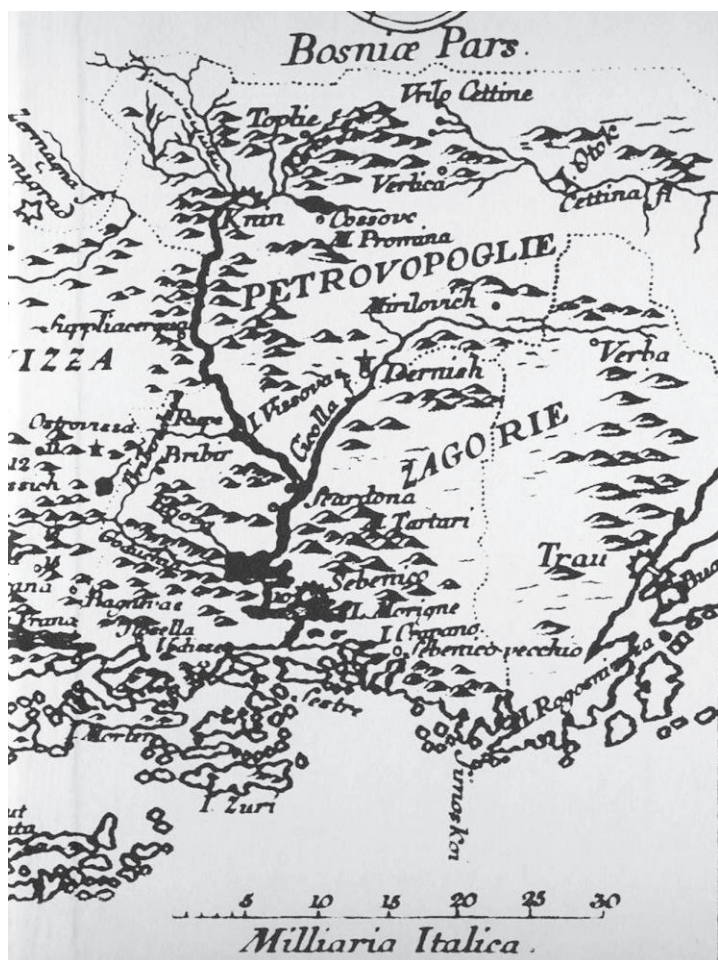
Figure 5. Excerpt from a reproduction of an engraving entitled Tabula Comitatus Zarensis et Sibenicensis ad illustrationem (by Joseph Marianus), Appendix 8 in Viaggio in Dalmazia by Alberto Fortis, 1774 (source: Fortis, A., Put po Dalmaciji , Croatian edition, 1984)

Slika 5. Isječak reprodukcije bakroreza Tabula Comitatus Zarensis et Sibenicensis ad illustrationem (autor Joseph Marianus); prilog br. 8 u knjizi Viaggio in Dalmazia Alberta Fortisa iz 1774. (izvor: Fortis, A., Put po Dalmaciji , hrvatsko izdanje, 1984)