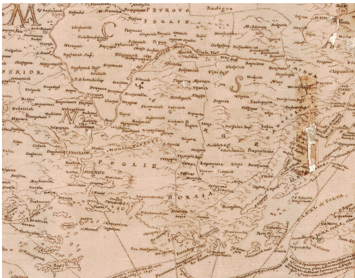
Figure 4. Excerpt from Disegno corografico della provincia di Dalmazia by an unknown author, dated 1718, with the toponym Xagorgie (source: National Archive in Zadar, Geographic and topographic maps of Dalmatia, call no. 6)

Prvi primjer je karta autora Stjepana Srkulja iz 1937. godine, naziva „Hrvatska za kralja Tomislava“ koja je dio