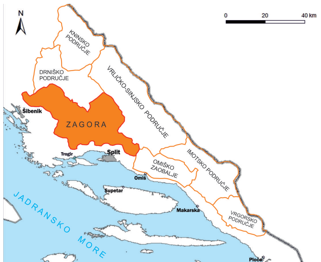
Figure 1 Traditional regions of the central Dalmatian hinterland with historical Zagora (Matas and Faričić, 2011)