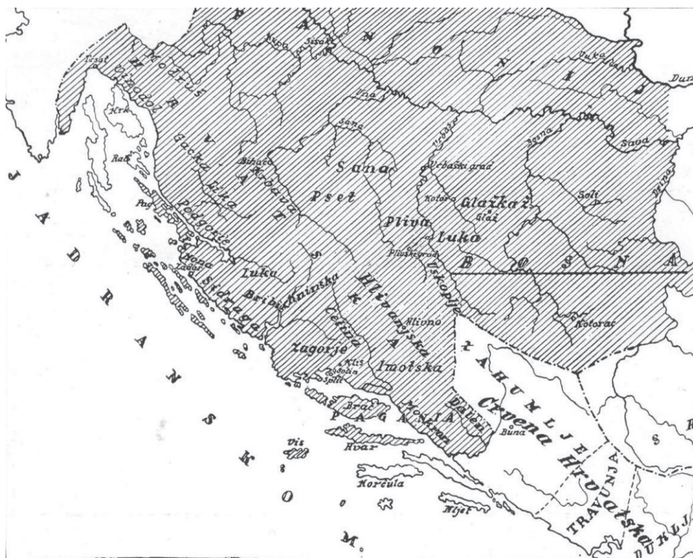
Figure 3. Excerpt from Croatia during the time of King Tomislav, 1942, in History of the Croatian Lands of Bosnia and Herzegovina (Pandžić 1992)

Slika 3. Isječak karte naziva Hrvatska za vrijeme kralja Tomislava iz 1942. iz: Poviest hrvatskih zemalja Bosne i Hercegovine (Pandžić 1992)