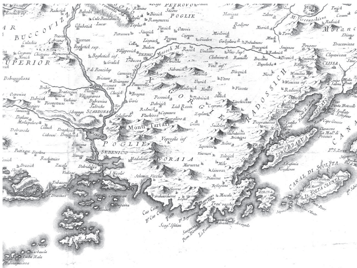
Figure 6. Excerpt from Nouvelle Carte de la Partie Occidentale de Dalmatie , 1780, by Pietro Santini

Među autentičnim starim kartografskim prikazima pojavnost toponima Zagora ili njegovih inačica najprisutnija je na onima mletačke izrade. Ističu se tri primjera iz 18. stoljeća, od kojih je najstariji onaj iz 1718. godine, karta naziva „Dissegno corografico della provinzia di Dalmazia“ nepoznatog autora (slika 4). Na isječku ovoga kartografskog prikaza vidljiv je istraživani toponim, i to u mletačkoj inačici starijeg naziva za ovo područje ( Xagorgie ). Prostor koji je toponimom obuhvaćen uključuje šibensko zaobalje sa sjeveroistočne