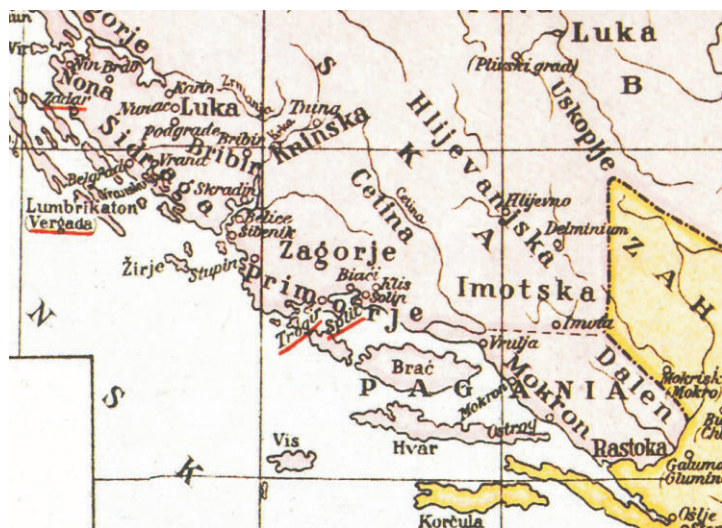
Figure 2. Excerpt from Croatia during the reign of King Tomislav (map no. 7 in the collection Croatian History in 19 Maps , 1937) by Stjepan Srkulj; original scale 1:2,700,000 (URL 1)

Given the fact that historical mentions of Zagora as a formal or traditional region are rather rare in cartographic sources, it is a relatively difficult task to reconstruct its precise extent from early time periods, especially the early Middle Ages. References are scarce, since the region often lacked administrative continuity. In recent decades, scientists and scholars who have made cartographic reconstructions of the medieval regions of Croatia have usually placed a variant of the toponym ( Zagorje ) within the framework of the historical region. This is obvious from two cartographic presentations