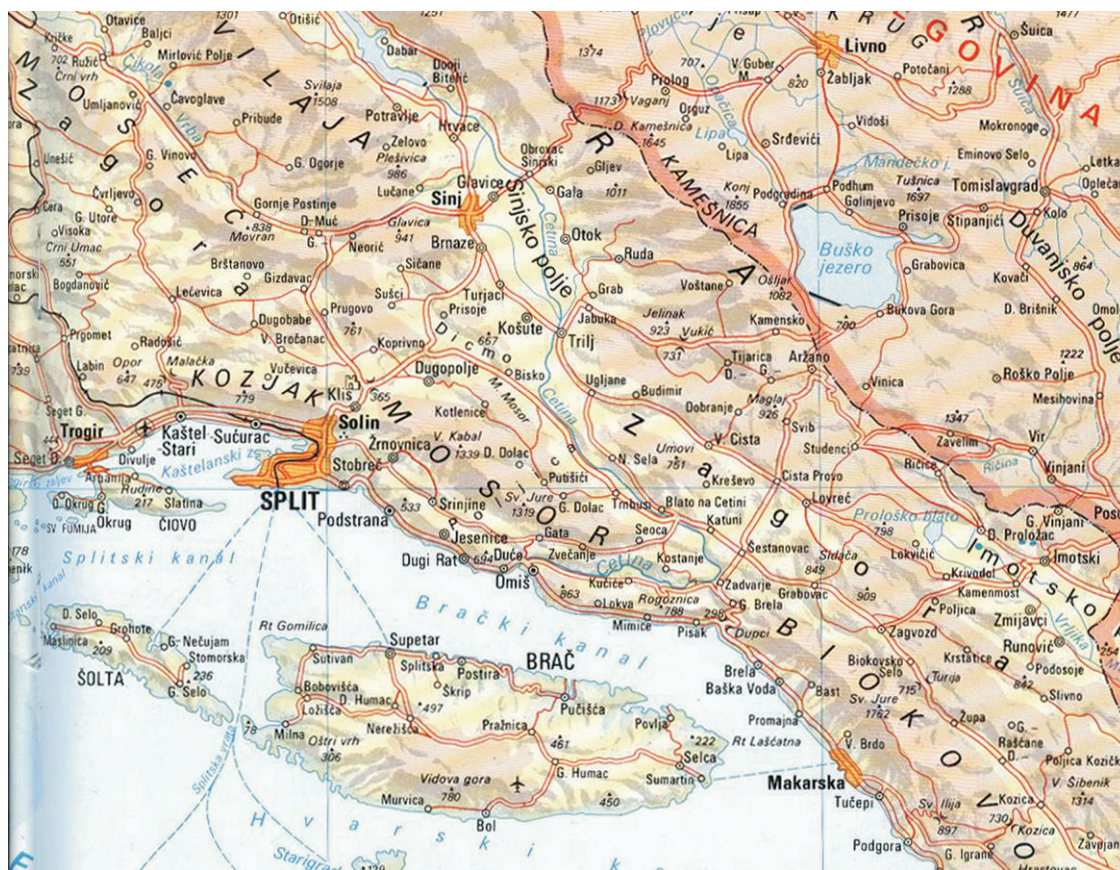
Figure 9. The toponym Zagora in Zemljopisni atlas Republike Hrvatske (1993), excerpt from the sheet ‘Split – Šibenik – Sinj’, original scale 1:500,000