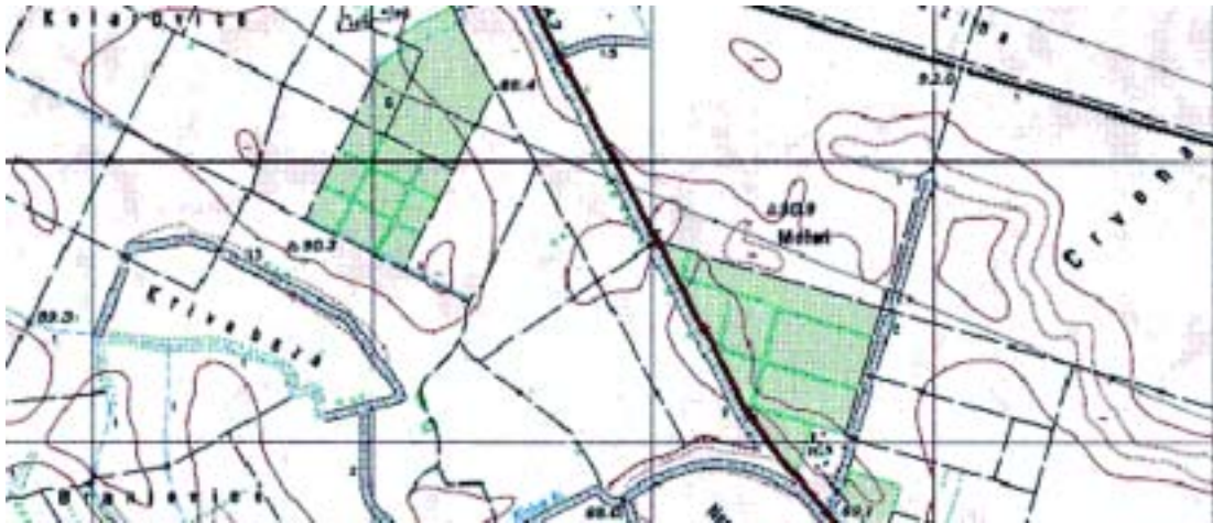
Slika 1. Isječak izvorne karte Fig. 1. Part cut out from a source map

spatial enhancement procedures, the purpose is to create a new image from the source image data with increased information quantity that can be visually interpreted (Javorović, 1994). Techniques of spatial enhancement modify the values of pixel based on grey values of the surrounding pixels. They change the characteristics of spatial image frequencies by averaging the grey value within the defined window around the pixel that needs to be modified.