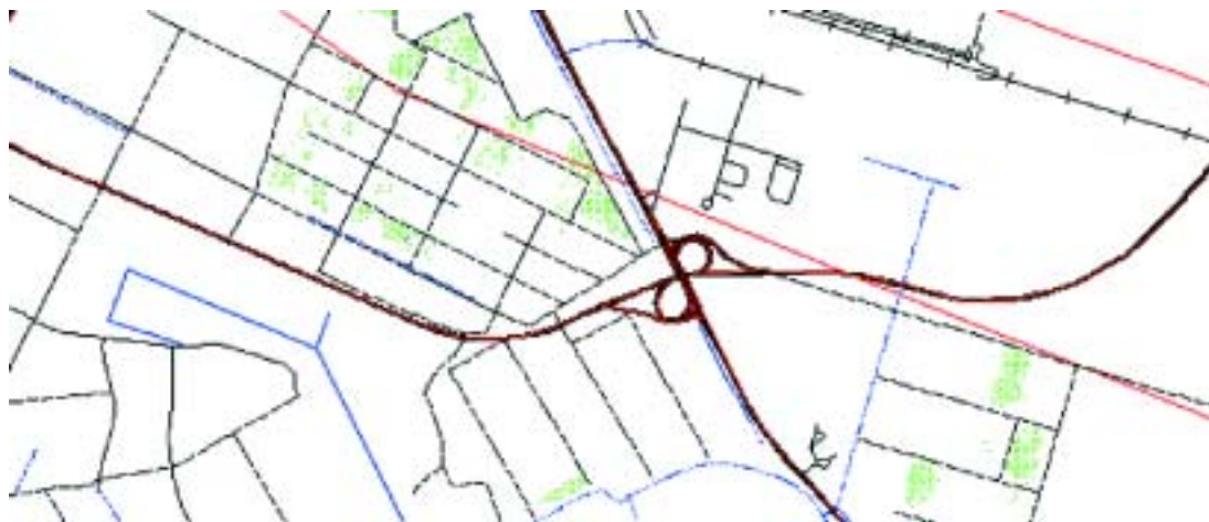
Slika 2. Isječak istog područja s nadopunjenim novim sadržajem Fig. 2. Part cut out of the same area with supplemented new contents

okolnih piksela. One mijenjaju karakteristike prostornih frekvencija snimka usrednjavanjem sive vrijednosti unutar definiranog prozora oko piksela koji treba biti modificiran.