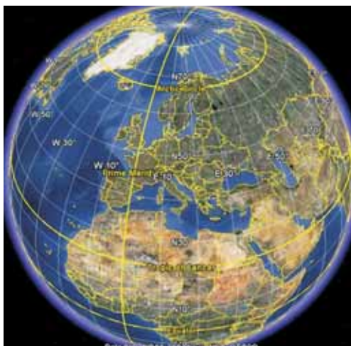
Fig. 1. Initial representation in Google Earth Sl. 1. Početni prikaz u Google Earthu

visualisation on screen, the text below the figure is confusing. The right part of Fig. 2 represents North and South America in Google Earth , which is clearly not a representation in the simple cylindrical projection.