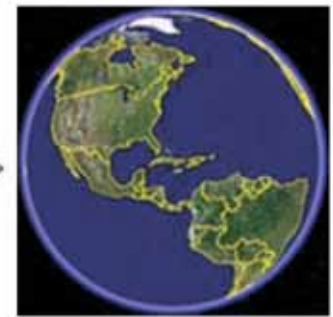
2. Google Earth Image Base